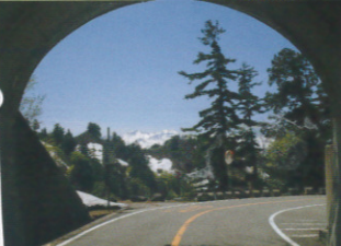
フォトすべてイメージ